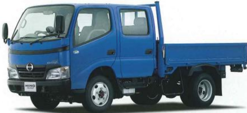
XZU378M-PKMMB (スタンダード) カタログ番号60 *車体色のブルー<BP0>、パワーミラー(助手席側)はメーカーオプション