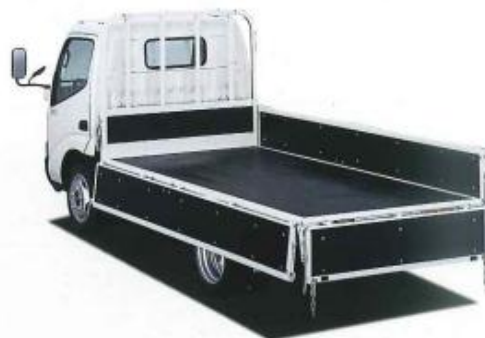
XZU344M-TKMQB (スタンダード) カタログ番号12