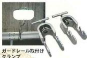
ガードレール取付けクランプ