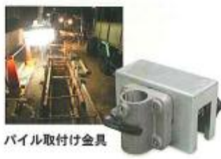
ハイル取付け金具